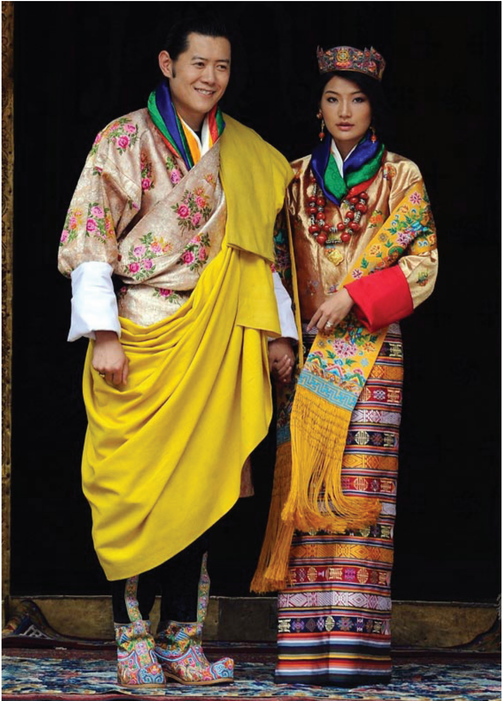
ཀྲུལ་ཁམས་གྱི་གནས་སྤངས་སྐོར་ ལོ་བསྟར་སྟན་ལུ་ཐེངས་ ༧ པ་འདི་ སྤྱི་ལོ་ ༢༠༡༡ ཟླ་༡༠ པའི་ ཚེས་༡༩ ལུ་བཙུན་ལུ་ཡོད་པའི་ཀྲུལ་བརྩམ་བཀའ་ཤིས་མངའ་གསོལ་གྱི་གུས་བཏུང་ལུ་ཨོན།